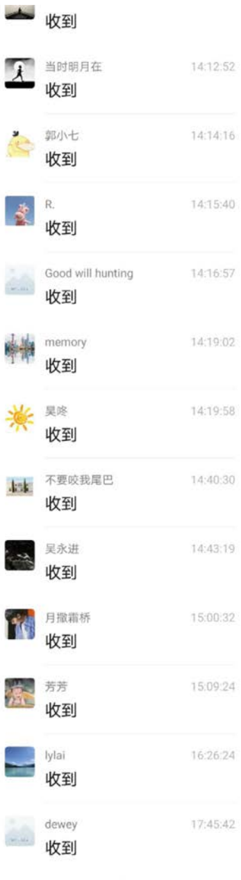
FIGURE 1. 沟通的链条