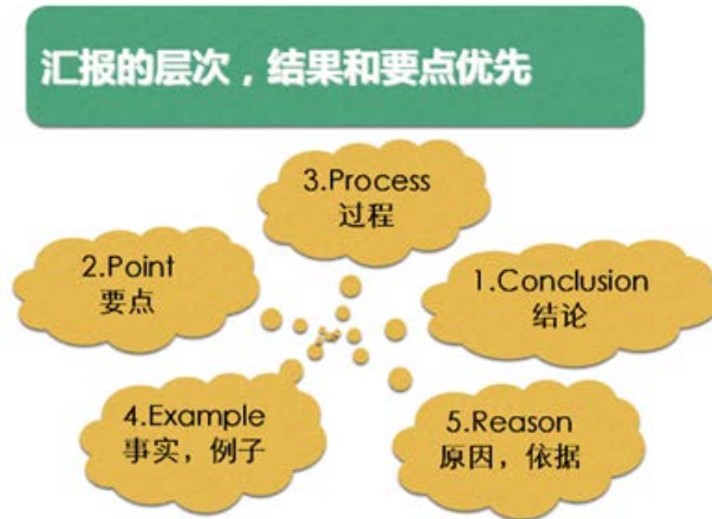
图 0-33 要汇报什么，做汇报的次序