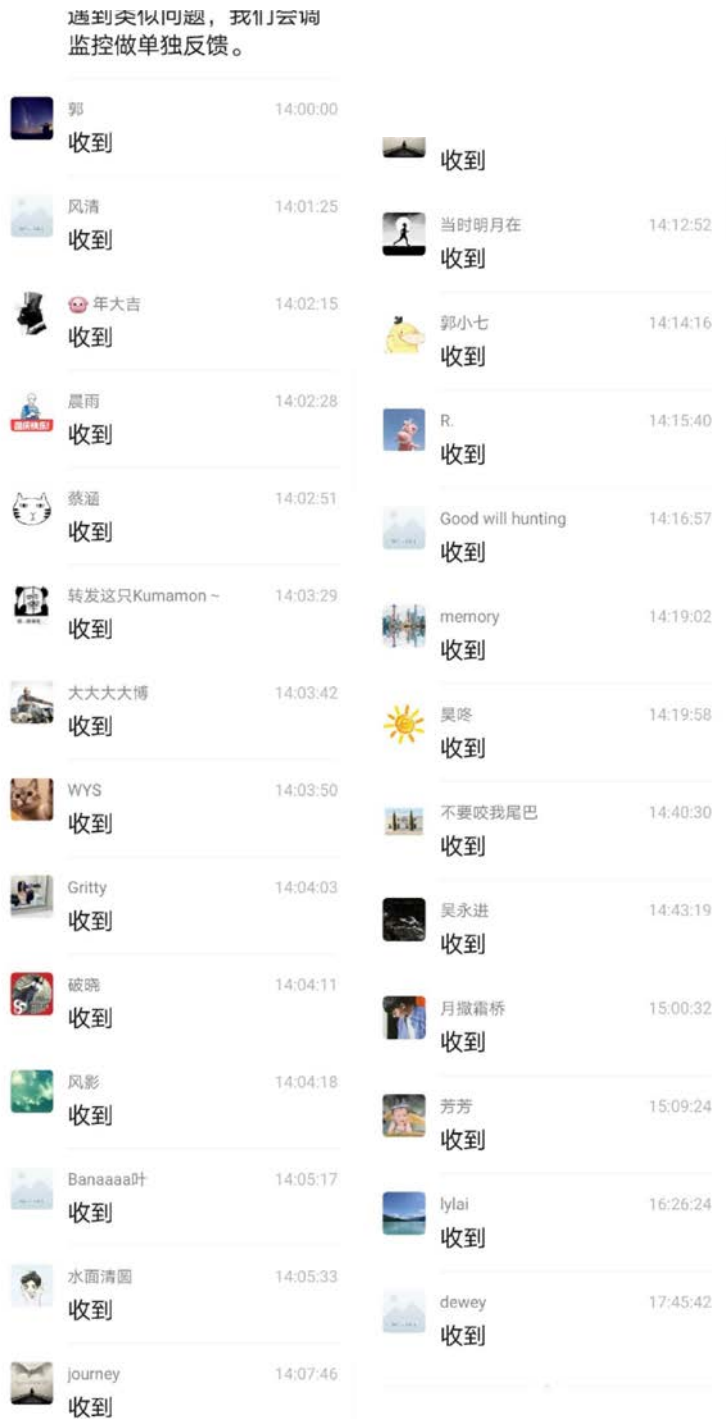
FIGURE 1. 沟通的链条